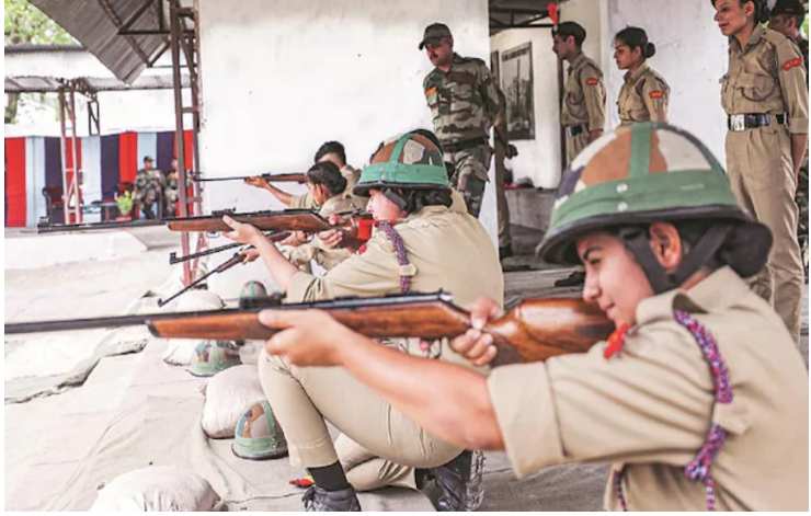
జమ్మూ-కాశ్మీర్, లద్దాఖ్ నుంచి 114 మంది క్యాడెట్లు... ఈశాన్య ప్రాంతం నుంచి 178 మంది

ఎస్సీసీ 2025 గణతంత్ర దినోత్సవ క్యాంపు డిల్లీలోని కలియప్ప పరేడ్ గ్రౌండ్ లో సోమవారం సర్వ ధర్మ పూజతో ప్రారంభమైంది. 917 మంది బాలికా క్యాడెట్లు ఈ క్యాంపులో పాల్గొంటున్నారు. అతిపెద్ద సంఖ్యలో బాలికా క్యాడెట్లు పాల్గొంటున్న క్యాంపుగా ఇది నిలవనుంది. నెల రోజుల పాటు జరిగే ఈ క్యాంపులో దేశంలోని మొత్తం 28 రాష్ట్రాలు, 8 కేంద్రపాలిత ప్రాంతాలకు చెందిన 2,361 మంది క్యాడెట్లు పాల్గొంటున్నారు.