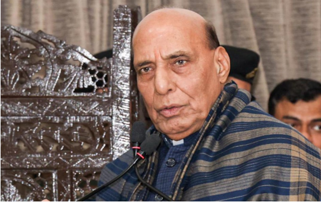
అంతరిక్ష యుద్ధం, సైబర్ దాడుల వంటి సంప్రదాయేతర యుద్ధ పద్ధతులు నేటి పరిస్థితుల్లో సవాళ్లుగా నిలుస్తున్నాయని ఆయన అన్నారు.

“నిరంతర పరిణామశీలంగా ఉన్న నేటి కాలంలో సరిహద్దు సాంకేతిక పరిజ్ఞానంపై పట్టు సాధించడం తక్షణావశ్యకత అనీ, ఈ దిశగా భవిష్యత్తులో ఎదురయ్యే సవాళ్లను ఎదుర్కొనేలా మన సైనికులను సన్నద్ధం చేయడంలో సైనిక శిక్షణ కేంద్రాలు కీలక పాత్ర పోషిస్తున్నాయి” అని రక్షణ శాఖ మంత్రి రాజ్ నాథ్ సింగ్ అన్నారు. మధ్యప్రదేశ్ లోని మౌ లో ఉన్న ఆర్మీ వార్ కాల్ జే (ఏడబ్ల్యూసీ)లో అధికారులను ఉద్దేశించి సోమవారం ఆయన ప్రసంగించారు. యుద్ధవిధానాల్లో వస్తున్న సమూల మార్పులను ప్రస్తావించి.. సమాచార యుద్ధం, కృత్రిమ మేధ (ఏఐ) ఆధారిత యుద్ధం, పరోక్ష యుద్ధం, విద్యుదయస్కాంత యుద్ధం,